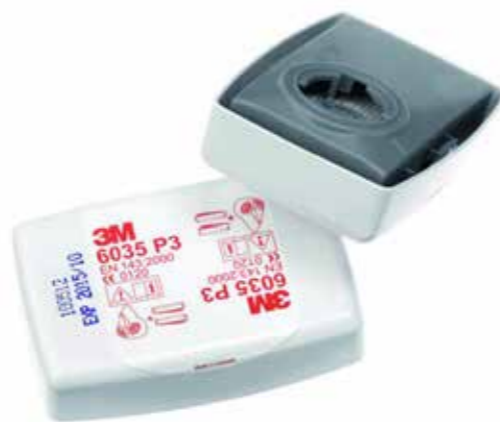
S36035F FILTER P3 92:-/PAR

Kapslade filter som monteras direkt på maskstommen 6035 skyddar mot: damm och partiklar. Säljs som par.