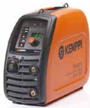
K61002180C1 MINARC 180 7 550:-

MINARC EVO 180 (MYKING) Att tala om enastående svetsprestanda är ingen överdrift. Varje del i Minarc Evo 180 är designad för att uppfylla kraven från svetsproffs som rör sig mycket i arbetet.