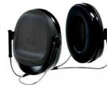
S3H505B596 HÖRSELKÅPA 310:-