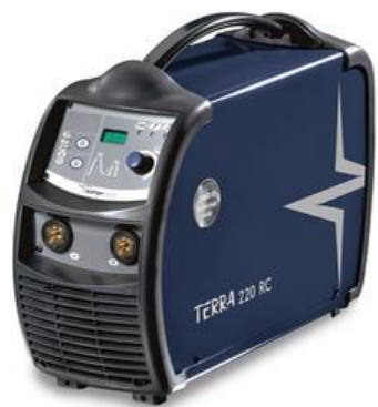
BM55.12.013 TERRA 220 RC 14 900:-

BÖHLER TERRA 220 RC Ny generation avancerad inverterteknologi strömkälla för hög hastighet dynamisk bågstyrning och överlägsen svetsprestanda.