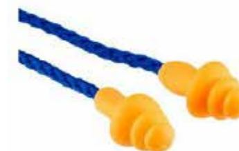
S31271F MED SNÖRE 15:-/PAR

Förformade hörselproppar med Tri-Flange-design som hjälper till att hålla hörselproppen på plats och lätt att föra in med skaffet där fingrarna kan hålla. Levereras med en förvaringsask med bältesklämma som hjälper till att förvara propparna på ett bekvämt, rent och skyddat sätt mellan användningstillfällena.