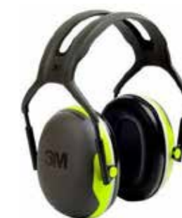
S3X1AGA HÖRSELKÅPA X1A 179:-

Erbjuder ett brett dämpningsutbud (från 27-37 SNR). Hjässbygel med skyddade ledningar är enkel att justera och den ger ett konstant och jämnt tryck över huvudet 3M™ PELTOR™ Hörselkåpor i X-serien kombinerar utmärkt skydd med optimal komfort.