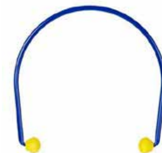
S3EC01000 EARCAPS 35:-/ST

3M™ E-A-R™ Caps hörselproppar med bygel är ett av de lättaste, halvt ljudgenomsläppliga hörselenheterna på marknaden.