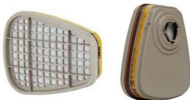
S36057FN FILTER ABE1 110:-/PAR

3M™ Filter mot organisk, oorganisk, sur gas och ånga, 6057, passar alla 3M™ Återanvändbara halv- och helmasker med en bajonettfästning, och är designade för att optimera ditt synfält. Säljs som par.