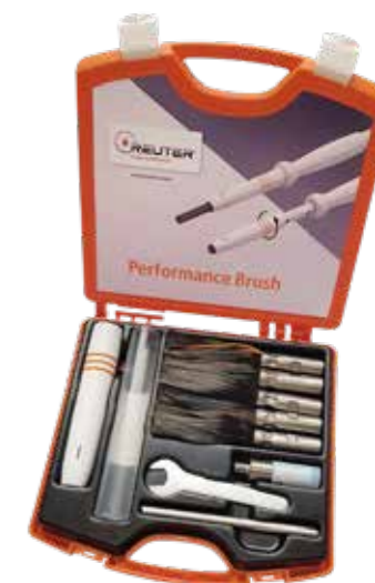
HAREP-02-927 START-KIT XL 3 875:-