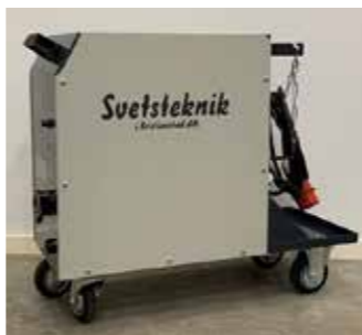
ERFI250 ERFI MIG 250 9 800:-

ERFI STANDARD MIG 250 NET Stegomkopplat MIG / MAG (7-steg) kompakt system för 400V med 250A max svetsström. Stabil 2-hjulsmatning. Praktisk synkron styrning och punkttimer. Inkl. 3m slangpaket, 5m godskabel & 15kg svetstråd.