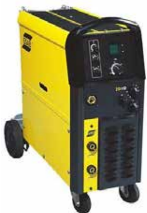
EM0349310830 C340 PRO 18 900:-

ESAB ORIGO MIG C340 PRO ORIGO MIG C340 PRO är en kompakt, stegreglerade MIG/MAG strömkälla med inbyggt matarverk. 4-hjuls drift.