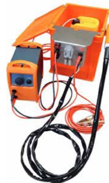
HAREP-01-060 CLEANOX AUTOFEED 21 195:-

CLEANOX AUTOFEED All vår teknik för Auto Feed-systemet är helt skyddad i den kompakta MagicBox. Detta är helt enkelt anslutet till vilken svetsrengöringsenhet som helst - som också tar över strömförsörjningen.