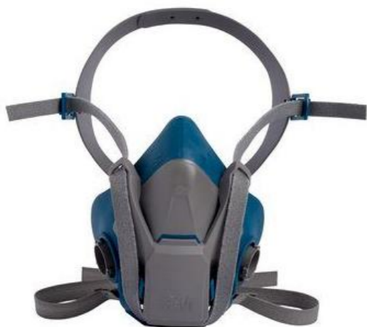
S36502QL HALVMASK MEDIUM 265:-

3M™ Återanvändbar halvmask har en robust konstruktion och en tålig, stabil ansiktstätning av silikon.