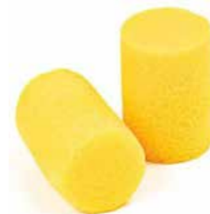
V400014 CLASSIC 520:-/FP

Idealiska att använda när buller är ett problem, antingen på jobbet eller fritiden. Skum som håller formen länge, och med mjukt tryck, anpassar sig till hörselgångens form för ökad komfort. 250 par/Fp.