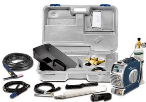
BM74.02.003 URANOS 1500 13 200:-

BÖHLER URANOS 1500 TLH Strömkälla med den senaste invertertekniken för perfekta svetsegenskaper. Byggt för tung användning. Mycket kompakt design.