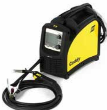
EM0349312030 C200i 9 990:-

ESAB CADDYMIG C200i En kompakt och bärbar 1-fas MIG/MAG-strömkälla på 200A med inbyggt matarverk för professionell MIG/MAG-svetsning i stål, rostfritt stål, aluminium och MIG-brazing.