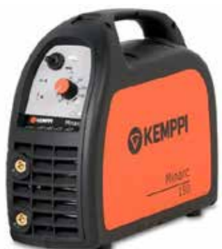
K6102150C1 MINARC 150 5 750:-

MINARC 150 CLASSIC (MYKING) MMA-maskinen Minarc 150 Classic (Myking) har låg vikt, är robust, pålitlig och stöttålig. Den är perfekt för användning i verkstäder och överallt på arbetsplatsen.