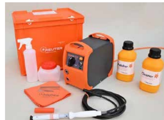
HAREP-01-013 CLEANOX 3.0-KIT 22 000:-

CLEANOX 3.0-KIT Kompakt och lätt, pålitlig och kraftfull: det är egenskaperna för nya Cleanox-serien. De är tillverkade för att passa i både verkstaden och byggarbetsplatsen där man kräver flexibilitet och pålitlighet.