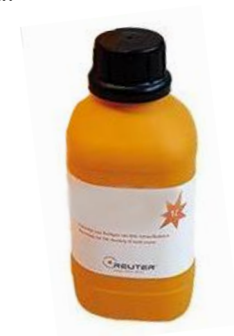
HAREP-04-130 CLEANER 175:- HAREP-04-132 POLISH 265:-

KOLFIBERPENSEL M10x12mm (XL) Kolfiberborste till EMO för polering och rengöring.