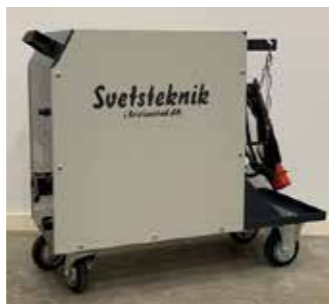
ERFI200 TWIN-MIG 200 7 200:-

ERFI TWIN-MIG 200 Stegomkopplat MIG / MAG (7-steg) kompakt system för 400V med 200A max svetsström. Stabil 2-hjulsmatning. Praktisk synkron styrning och punkttimer. Inkl. 3m slangpaket, 5m godskabel & 15kg svetstråd.