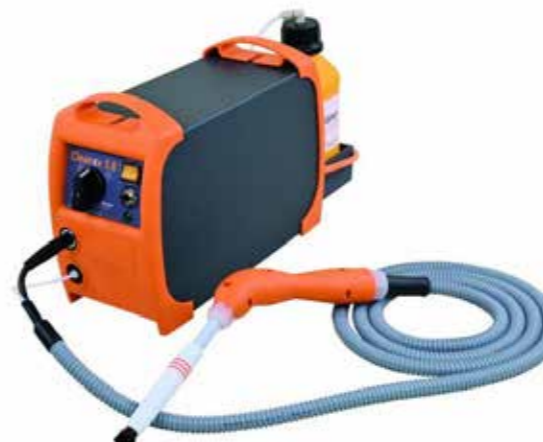
HAREP-01-015 CLEANOX 5.0-KIT 47 000:-

REUTER CLEANOX 5.0 SET Reuter Cleanox 5.0 med automatiskt elektrolytflöde är en av marknadens i särklass bästa maskin för rengöring/polering av TIG och MIG svets sömmar. Lämpar sig även utmärkt för märkning med eller utan schablon.