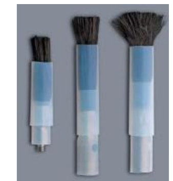
HAREP-02-912 PENSEL 670:-/ST

KOLFIBERPENSEL M10x12mm (XL) Kolfiberborste till EMO för polering och rengöring.