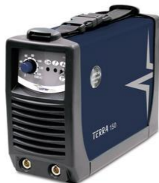
BM55.12.016 TERRA 150 4 200:-

BÖHLER TERRA 150 Avancerad strömkälla med inverterteknologi för överlägsen bågprestanda. Inkl. svetskablar.