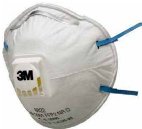
S38822F FILTERMASK 245:-/FP

3M™ Filtrande halvmask ger bekvämt och effektivt andningsskydd med låg vikt mot damm och imma. 10st/Fp