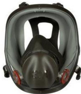
S36800S HELMASK MEDIUM 1 238:-

3M™ Återanvändbar helmask i 6000-serien har ett stort visir av polykarbonat och en mjuk, allergivänlig maskstomme av elastomermaterial. 3M™ Bajonettfäste gör det möjligt att ansluta en mängd olika dubbla lättviktsfilter från 3M. De lätta helmaskerna har en 3M™ Cool Flow™ Ventil och sitter på plats med fyra remmar.