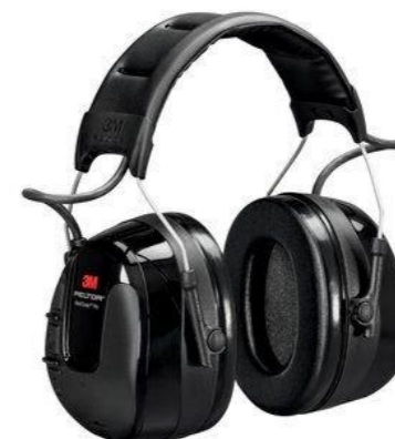
S3HRXS220A WORK TUNES PRO 799:-

3M™ PELTOR™ WorkTunes™ Pro headset skyddar dig från skadligt buller på arbetsplatsen och gör det möjligt att lyssna på den inbyggda FM-radion. Headset med FM-radio och inbyggd antenn, så att den inte fastnar i utrustning 3,5 mm ljudingång för stereo (begränsat till 82 dB) för anslutning till externa enheter (t.ex. mobiltelefon, radio, tvåvägsradio eller iPod) Automatisk avstängning efter 4 timmar av inaktivitet sparar batteritid och en varning för låg batterinivå indikerar när det är dags att byta batterier För att undvika korrosion orsakad av svett har elektroniken placerats i hörselkåpans yttre del.