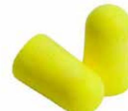
S3ES01001 EAR-SOFT 300:-/FP

De har en slät yta för komfort i örat och är tillverkade av en avancerad skumgummiformel för att kunna användas hela dagen. De erbjuds i en storlek som passar bekvämt i ett stort antal öron. Dessa högdämpande hörselproppar är idealiska för många olika bullertillämpningar. 250 par/Fp.