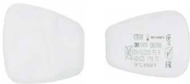
S35935F FILTER 5935 72:-/PAR

Kan användas med alla 3M™ återanvändbara masker med bajonettfästning. Säljs som par.